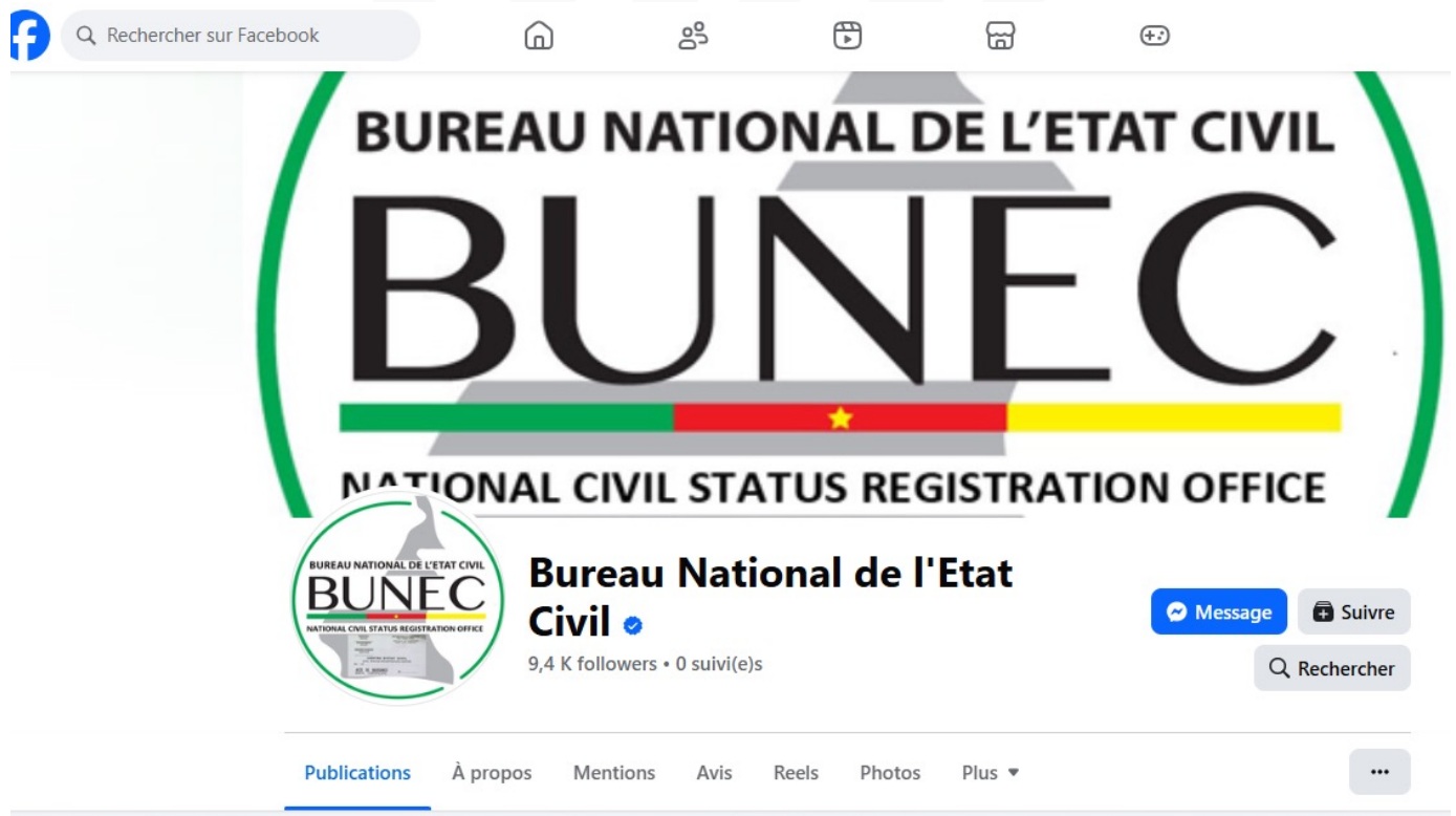
Capture d'écran de la page Facebook

En l'absence d'un dispositif de communication cohérent articulé autour d'un site web, de plateformes sociales et d'outils de diffusion adaptés, ces institutions demeurent peu visibles dans l'espace public, ce qui entrave la compréhension de leurs missions, de leurs réalisations et de leur contribution effective aux objectifs fixés par le gouvernement dans la SND 30.